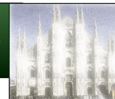
Pharm Tech GazzaLaB

GMP, QbD, QRM, PQS, QP, ICH Q8-Q10: un labirinto di regole o un'armonia di filari in un campo fertile per il miglioramento della qualità?